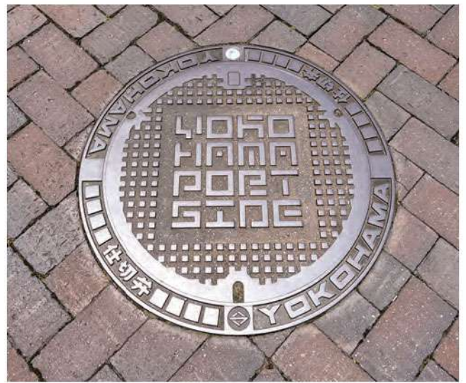
▲ロゴマーク入マンホール

マンホールの蓋にはポートサイド地区のロゴマークの入っているものが見ることができます。