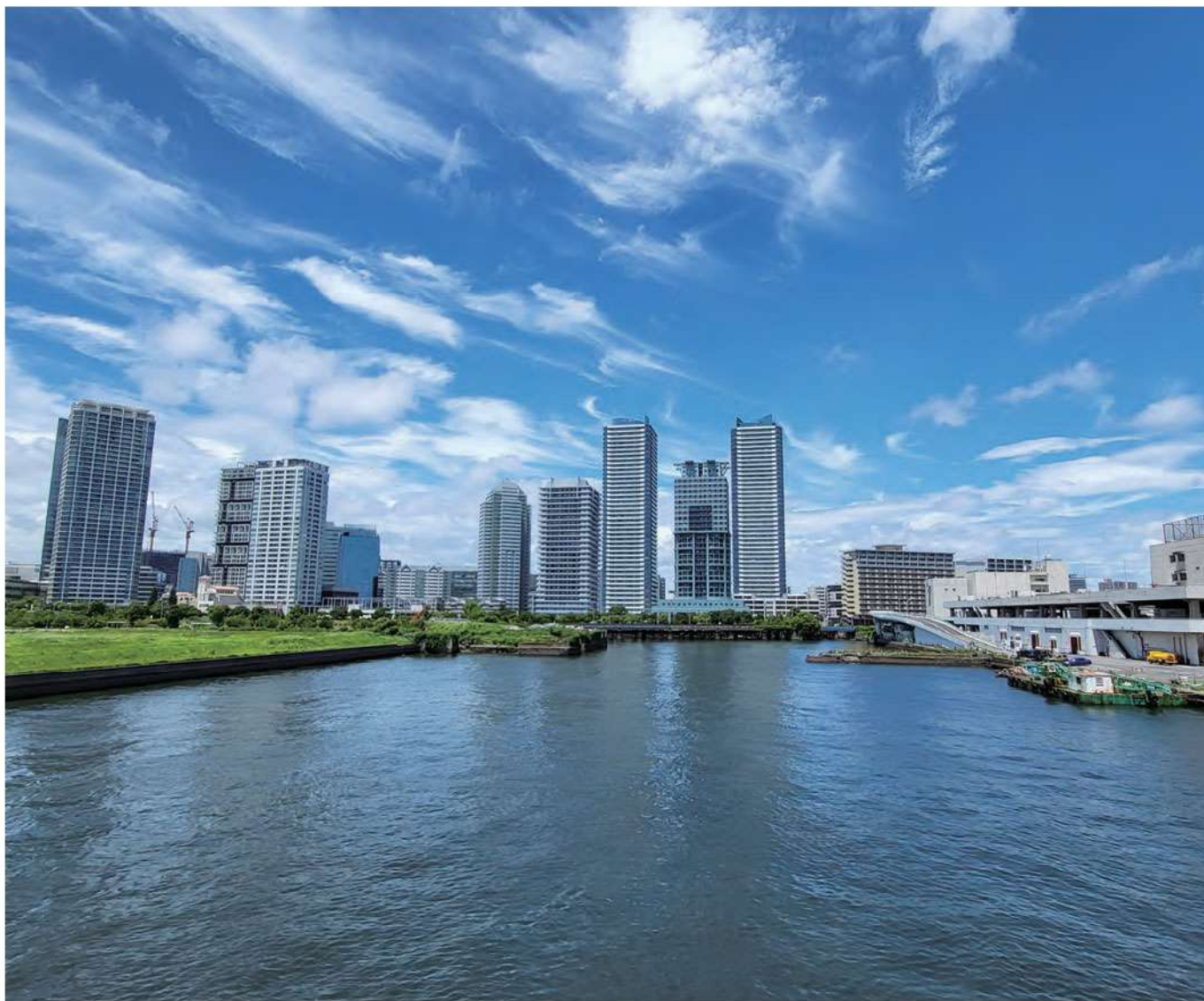
▲みなとみらい大橋から眺めるヨコハマポートサイド地区

横浜市中心卸売市場本場にも近く、港湾部の水際線を挟んで対岸にはみなとみらい地区が望めるほか、地区内の一部からは横浜マリンタワーやベイブリッジを見することもできます。