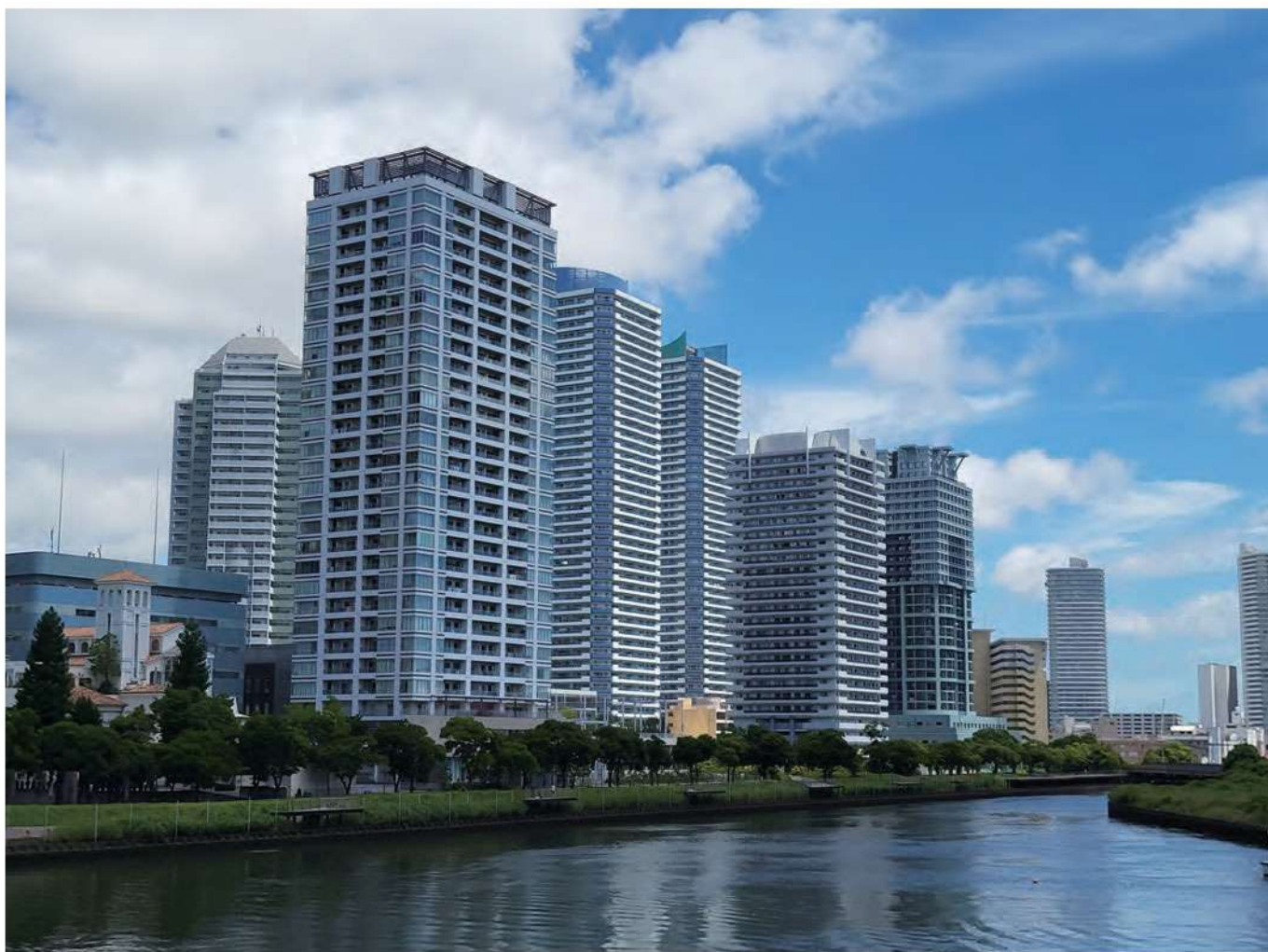
▲みなとみらい大橋から眺めたヨコハマポートサイド地区

一部・大野町（おおのちょう）・栄町（さかえちょう）の一部からなり、横浜駅の東側に位置しています。