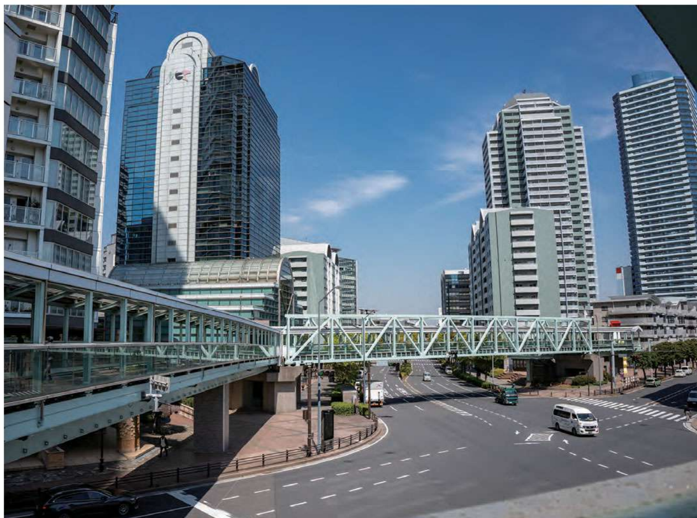
▲グリーンウォーク

さらにポートサイド中央交差点付近から、みなとみらい大通りのみなとみらい大橋が当地区とみなとみらい地区とを結んでいます。