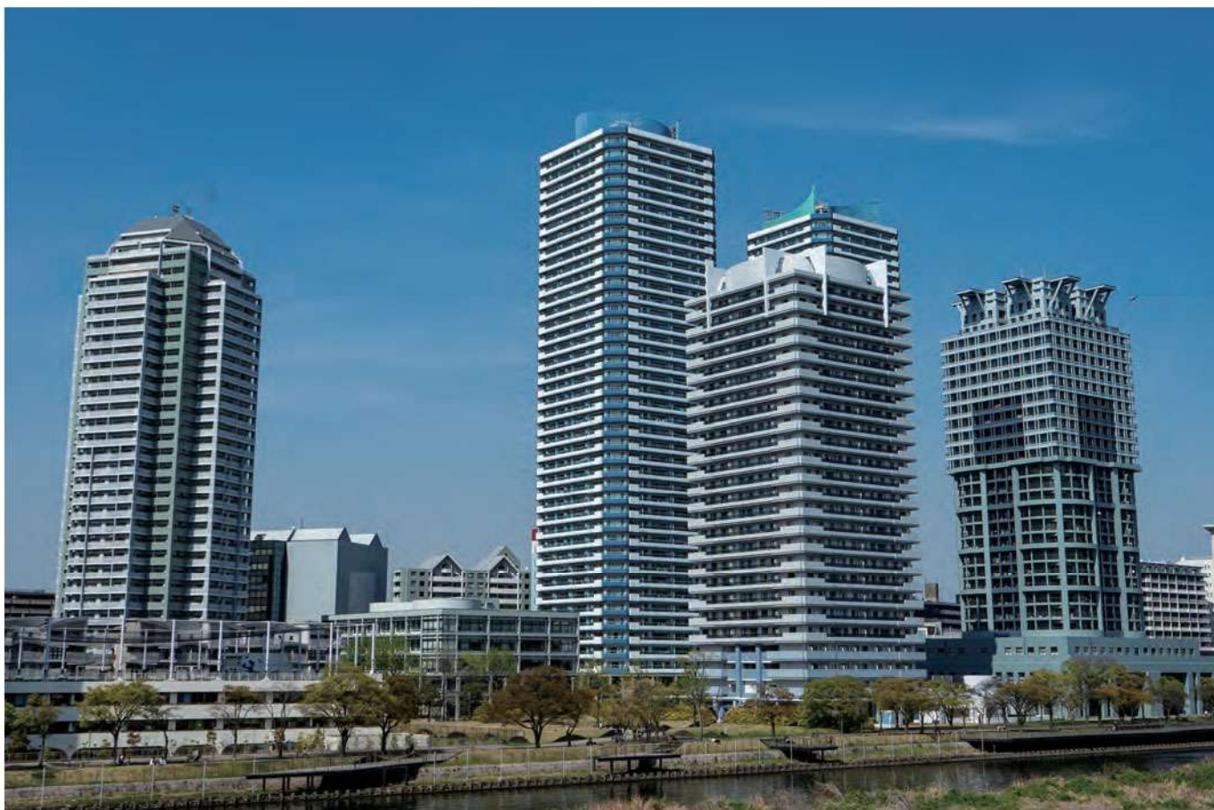
▲ヨコハマポートサイド地区のタワーマンション群

1990年（平成2年）頃より「アート&デザインの街」をコンセプトとする再開発が始まり、幅員の広い歩道が確保された道路やペDESTリアンデッキが整備されたほか、地区内の無電柱化が実施され、現在は、電柱・電線の無い広い空間にタワーマンションや高層オフィスビルなどが大空に向かってそびえ立つ光景が広がっています。