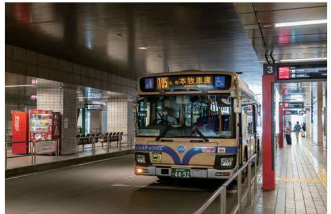
▲横浜駅東口バスターミナル