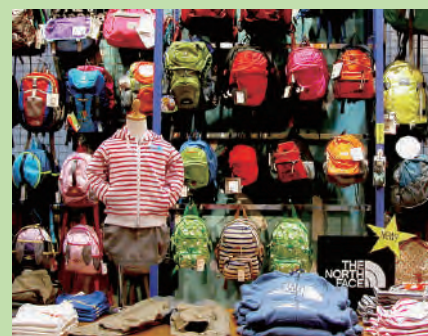
Outdoor-fashion especially KIDS & BABYs 1F ▲