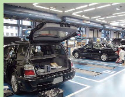
▼ Techno Shop 2F