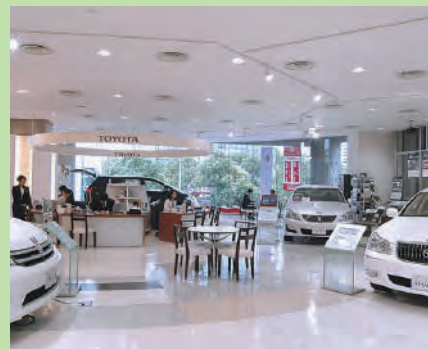
▼ Show-room 2F